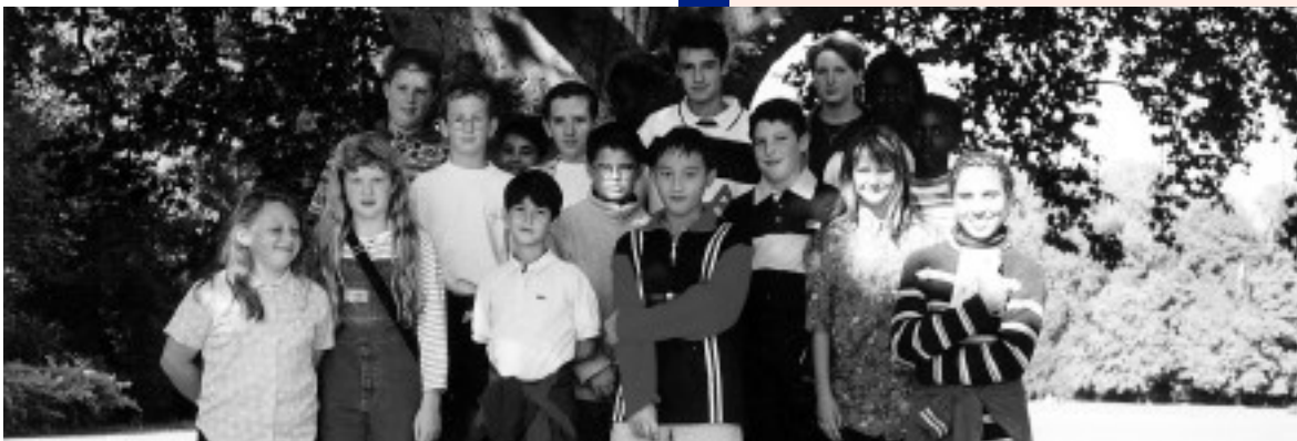
Avec les élus de Noisiel

Tournoi indoor de tir à l'arc (400 participants), au gymnase Roger Couderc.